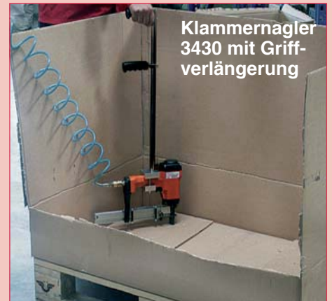
Klammernagler 3430 mit Griff- verlängerung