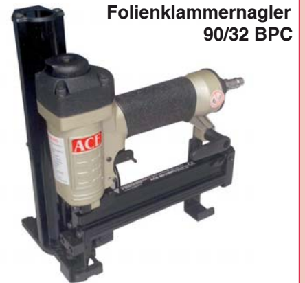
Folienklammernagler 90/32 BPC