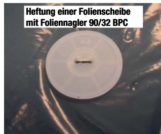
Heftung einer Folienscheibe mit Foliennagler 90/32 BPC

Heftklammern lieferbar in: - verzinkt - rostfrei - Aluminium