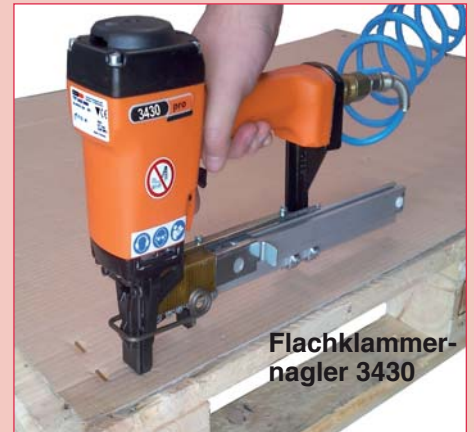
Flachklammer- nagler 3430